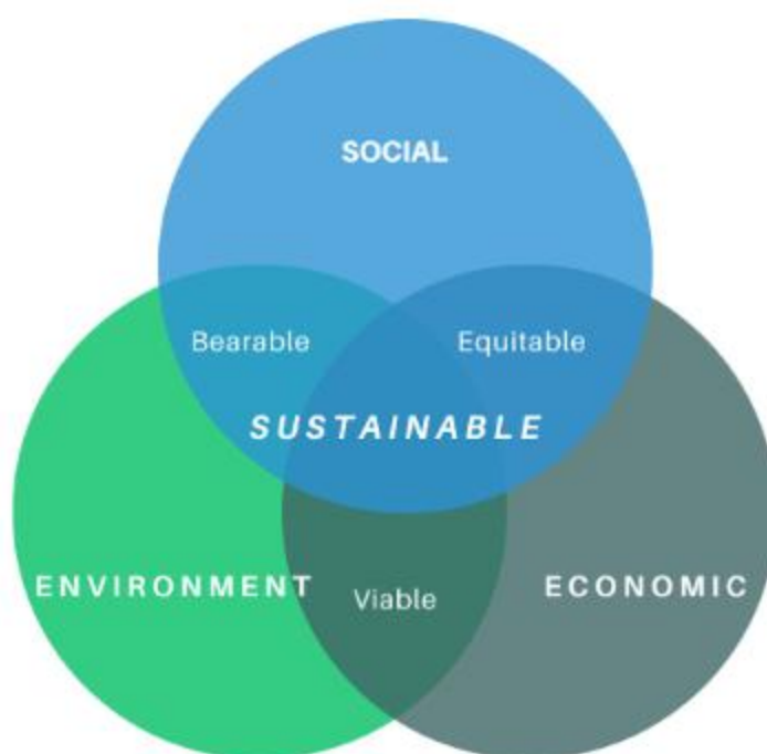
Gambar 1 Keterkaitan Antara Berbagai Paradigma Keberlanjutan